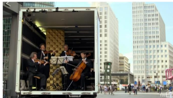
Un quartet du Philharmonique jouant un mouvement d'une pièce de Beethoven dans un camion sur Potsdamer Platz à Berlin.