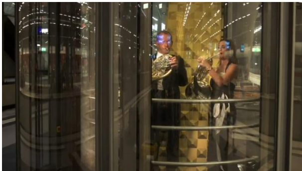
Une pièce de Bach jouée par deux cornistes dans le métro de Berlin

Présentation en ligne de toute l'expérience : http://www.berliner-philharmoniker.de/en/25-years-chamber-music-hall/videos/