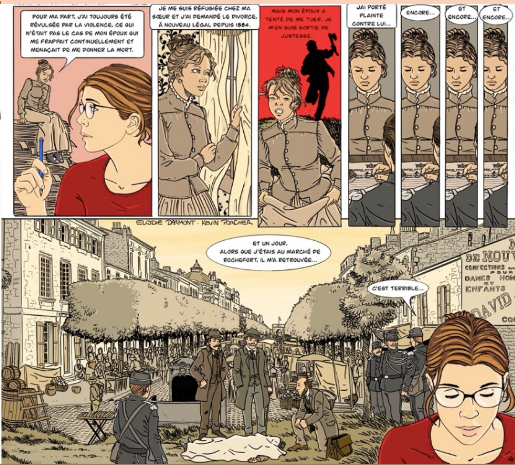
Dessin : Kevin Porcher