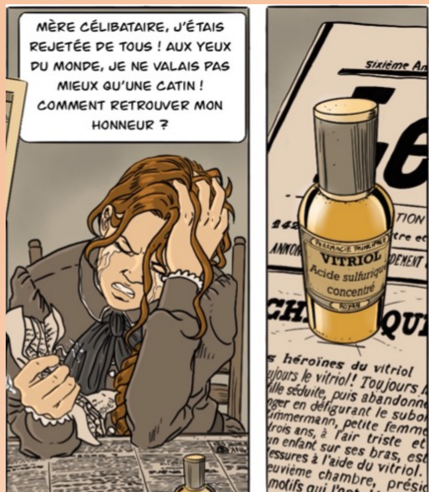
Dessin : Kevin Porcher

La réputation étant le curseur de la vie sociale et professionnelle, il est important pour toute une chacune de trouver un moyen de « laver » son honneur. Le vitriol - acide jeté au visage de l'amant inconstant ou d'une autre maîtresse - est alors un moyen de faire savoir à tous que l'inconduite n'est pas uniquement celle de la femme. Sujet surexploité par la presse, l'usage du vitriol n'est cependant pas si répandu que cela (6 cas en Charente-Inférieure sur l'ensemble de la période)