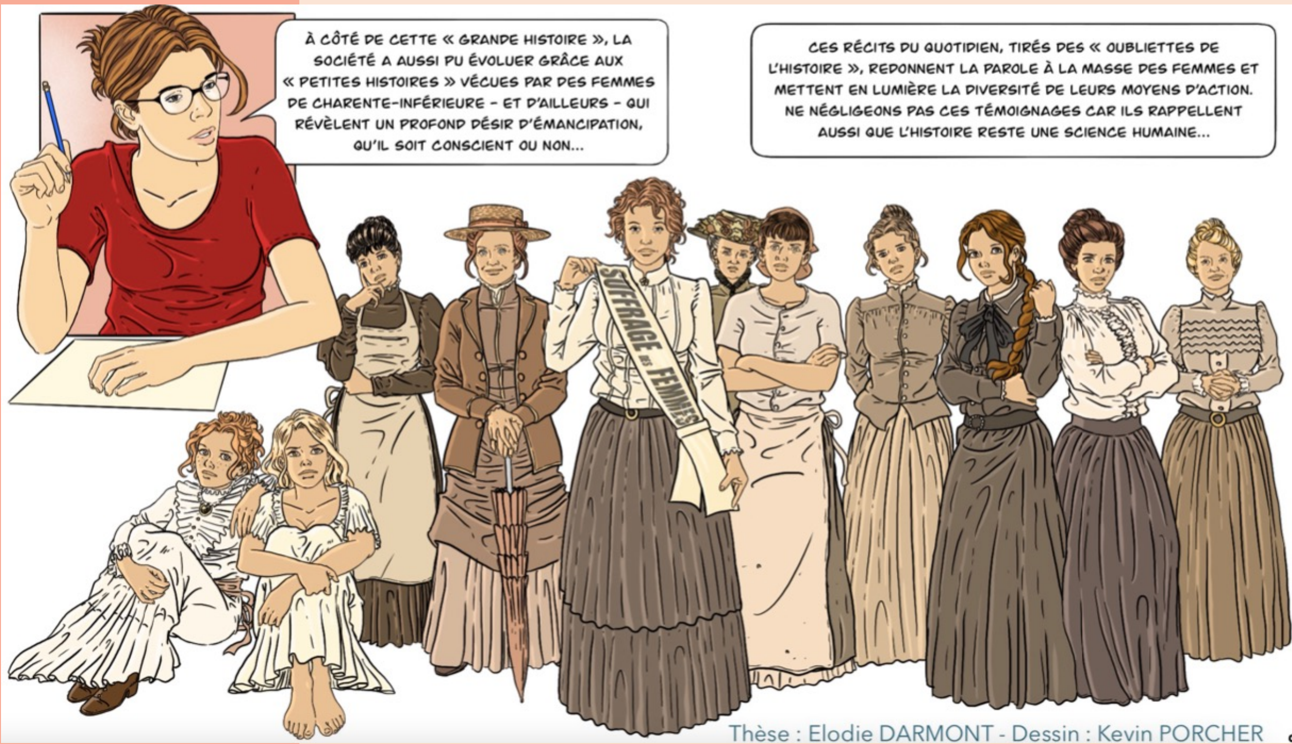
Thèse : Elodie DARMONT - Dessin : Kevin PORCHER

Ma thèse vise à approcher au plus près la vie quotidienne, les émotions et les ressentis des femmes de Charente-Inférieure. Ma recherche concerne autant les rurales que les urbaines, les femmes du littoral que celles de l'intérieur des terres. La période charnière de l'étude (1870-1914), ainsi que le choix d'adopter un point de vue gynocentrique (centré sur les femmes), permettent de donner à entendre les voix des femmes selon des méthodes historiques.