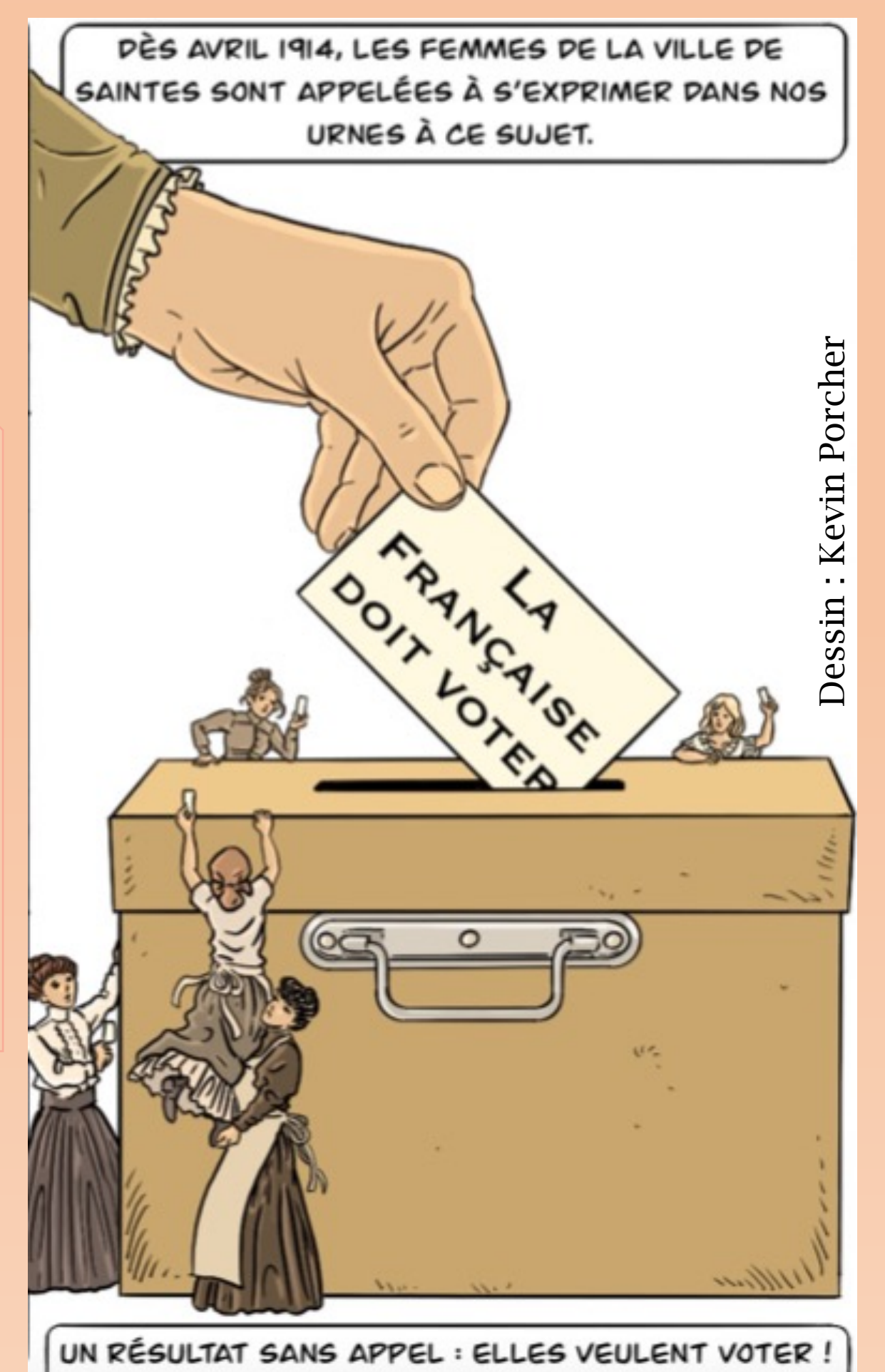
Dessin : Kevin Porcher